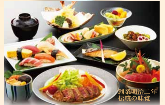
創業明治二年 伝統の味覚

お会席料理 会席料理の決定版 あずま かい せき 東会席 [二汁七菜] ¥6,000(税込) 口取/刺盛/焼魚/天ぷら/牛ヒレステーキ/ うざく(酢の物)/茶碗むし/おすし/お吸物/デザート ミニ会席各種 ¥3,520 より取り揃えています