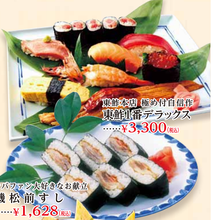
東鮮本店 極め付自信作 東鮮1番デラックス .....¥3,300(税込)