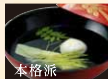
本格派 お吸物...¥385(税込)

■定休日/毎週月曜日 ■営業時間/午前10時半~夜9時迄 (午後2時~5時クローズ) 〒460-0008 名古屋市中区栄1-5-21 DAIWA ROYAL HOTEL D-CITY 名古屋伏見 1階 (広小路・御園 地下鉄伏見駅下車7番出口すぐ)