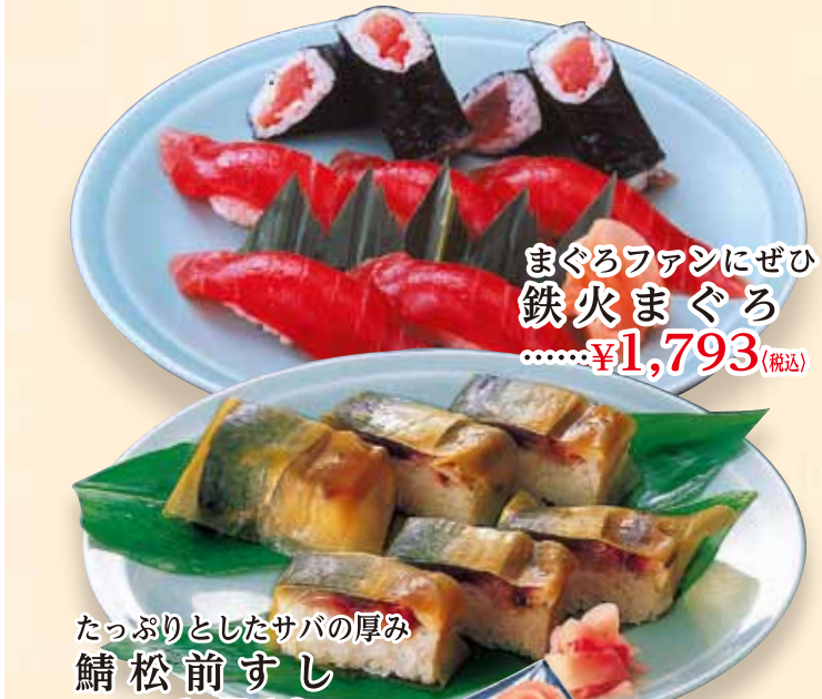
まぐろファンにぜひ 鉄火まぐろ .....¥1,793(税込)

お会席料理 会席料理の決定版 あずま かい せき 東会席 [二汁七菜] ¥6,000(税込) 口取/刺盛/焼魚/天ぷら/牛ヒレステーキ/ うざく(酢の物)/茶碗むし/おすし/お吸物/デザート ミニ会席各種 ¥3,520 より取り揃えています