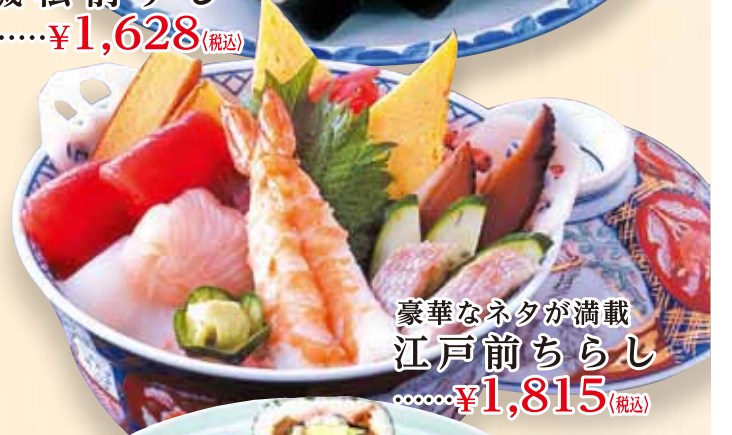
豪華なネタが満載 江戸前ちらし .....¥1,815(税込)