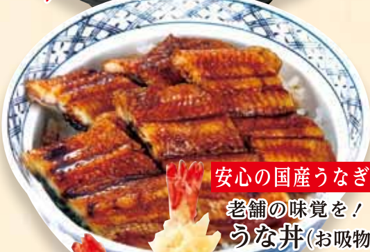
安心の国産うなぎ使用 老舗の味覚を! うなぎ(お吸物付) .....¥2,992(税込)