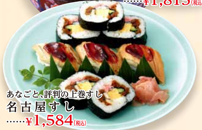
あなごと、評判の上巻すし 名古屋すし .....¥1,584(税込)