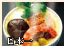
国本一 茶碗むし...¥880(税込)