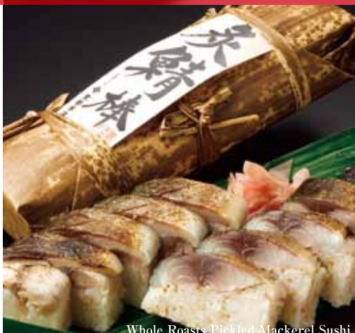
Whole Roasts Pickled Mackerel Sushi