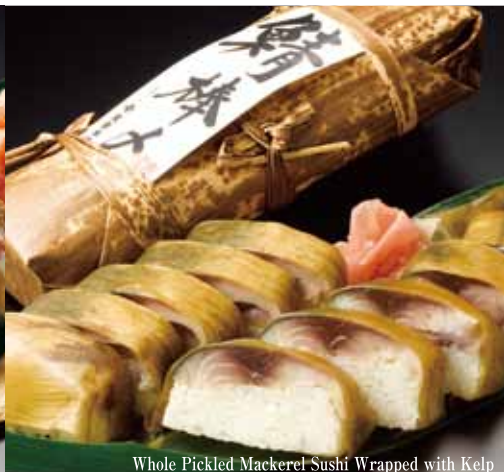
Whole Pickled Mackerel Sushi Wrapped with Kelp