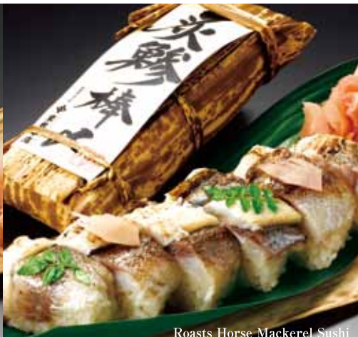
Roasts Horse Mackerel Sushi