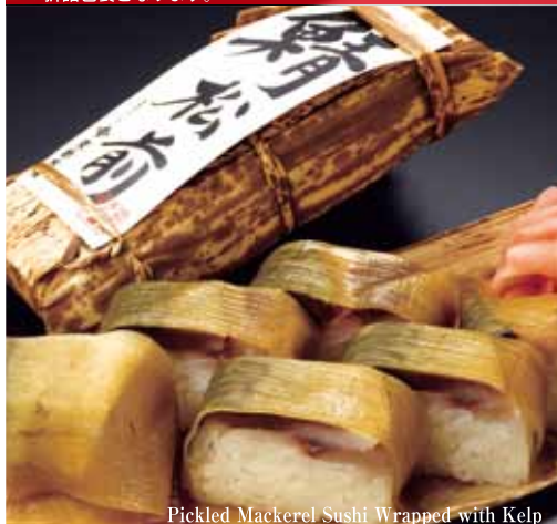
Pickled Mackerel Sushi Wrapped with Kelp