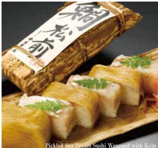
Pickled Sea Bream Sushi Wrapped with Kelp