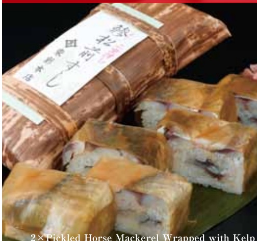
2x Pickled Horse Mackerel Wrapped with Kelp