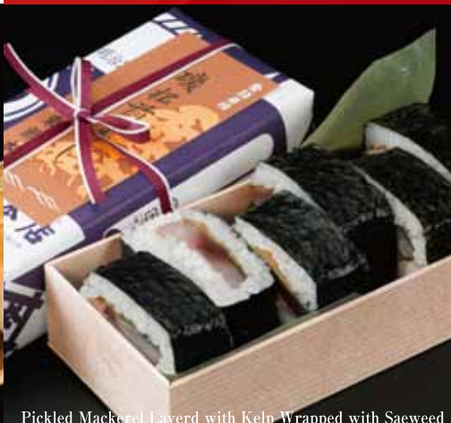
Pickled Mackerel Layerd with Kelp Wrapped with Saeweed