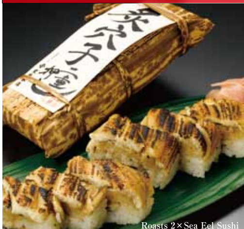
Roasts 2x Sea Eel Sushi