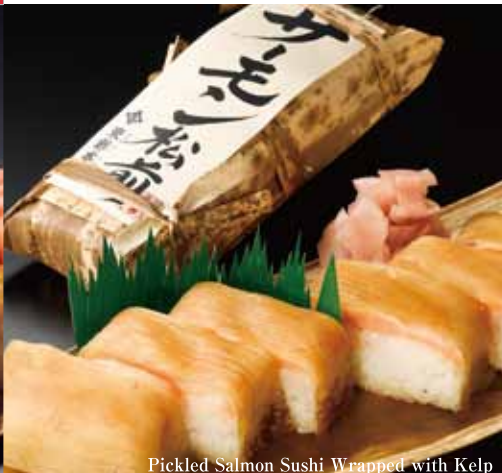
Pickled Salmon Sushi Wrapped with Kelp